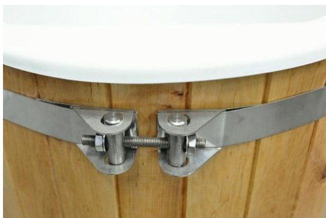
Mechanismus stahování obručí, příklad napouštění kádě.

Samotná konstrukce kádě pro 2 osoby - ručně vyrobená z olšového dřeva, lakovaného lodním lakem. Vnitřní vložka - akrylátová, hygienická a snadno udržovatelná. Kád' je vybavena stahovatelnými nerezovými obručemi. Díky nim je zajištěna dlouhá životnost dřevěné konstrukce - máte možnost kád' přizpůsobit práci dřeva v různých vlhkostních podmínkách. Součástí je gumový špunt, olšové schůdky a vnitřní vytvarovaná sedátka pro pohodlné sezení 2 osob.